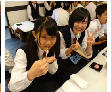
【甘春堂にて和菓子づくり】