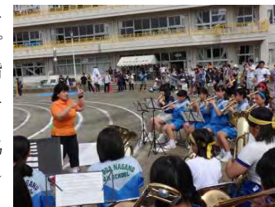
【北小OBが選手入場に協力】

5月27日(水)本校にて、第1回小中連携推進会議を行いました。この取組は、中1ギャップから中1ジャンプの発想のもと、スムーズな小学校から中学校の移行を目指し、「つなぐ」をキーワードに平成25年度から始まった事業です。各学校から担当者が出席し、今年度の取組や4校の生活のルール、6年生担任の中1授業参観について協議しました。各小学校の皆さん、今年もよろしくお願い致します。