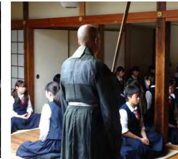
【座居庵にて座禅体験】