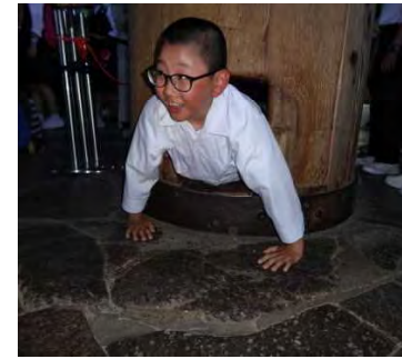
【東大寺大仏殿柱の穴くぐり】