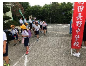
小中連携あいさつ運動