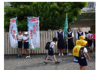
小中連携あいさつ運動